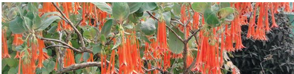
© Fuchsia bota arboretum / A. Le Borgne